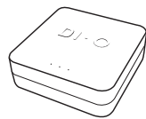
ED-GW-01 Dio Home Box